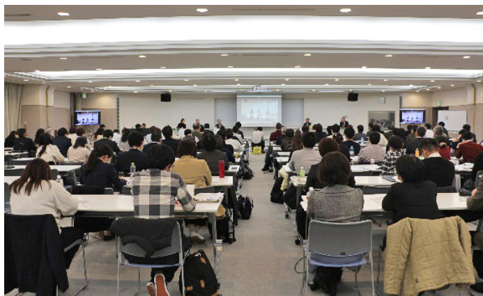
シンポジウム的一幕

総括のディスカッションでは、いずれの実践も共通項として、住民自治の発想及び自治組織との関係性があること、難しい問題に「楽しく」取り組んでいること、個人の意思表示や問題共有には住民流の手法があること、行政の重要性を感じていることが確認され、こうした実践者・地域で暮らす住民の側に立って研究者や支援者は職を全うすべきことが共有され、熱気あふれる大会を締めくくりました。