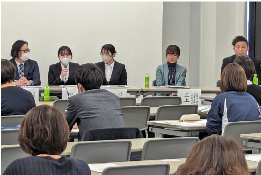
令和5年度中国部会セミナーのシンポジウムの様子