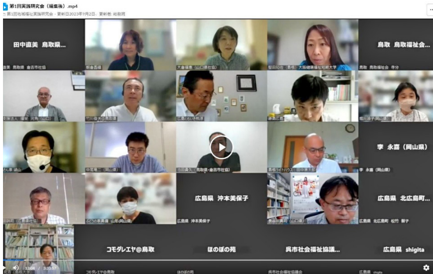
第1回地域福祉実践研究会（オンライン開催）の様子