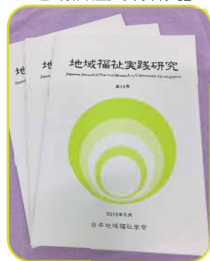
『地域福祉実践研究』